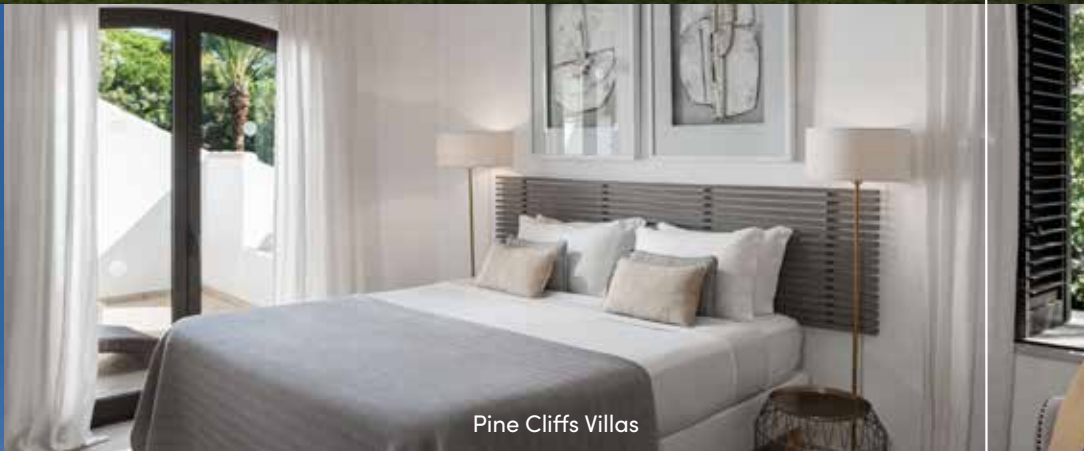
Pine Cliffs Villas