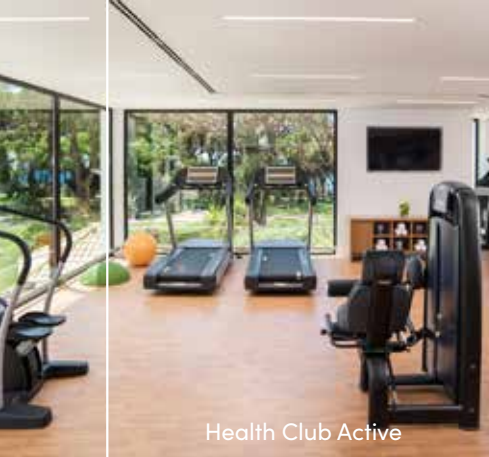
Health Club Active