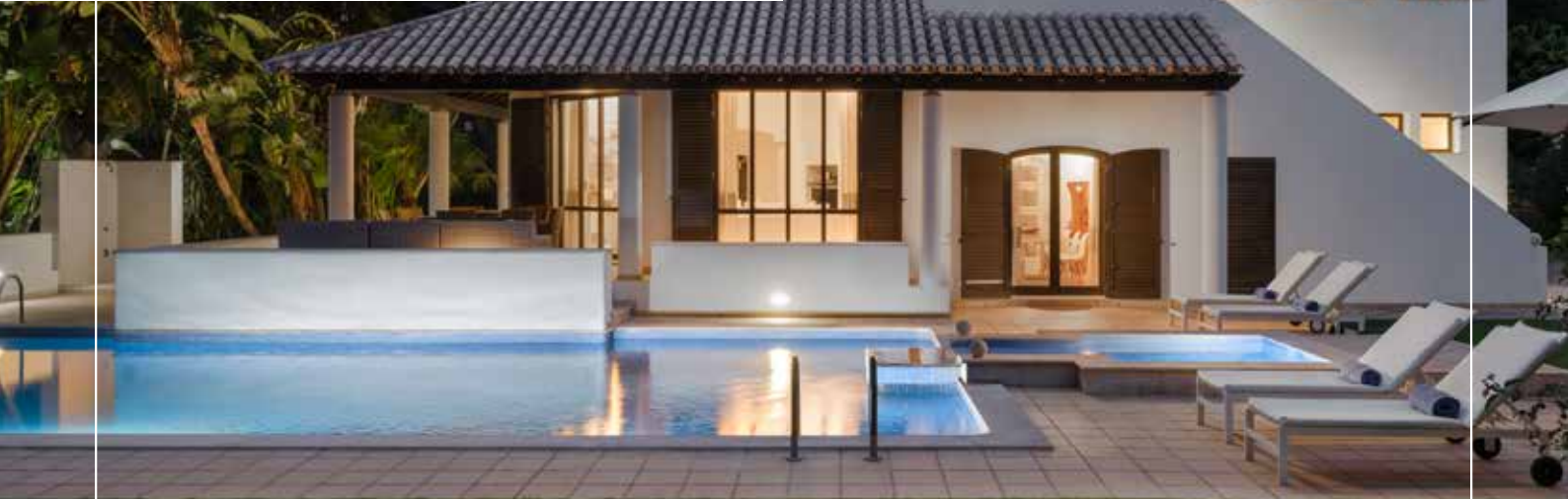
Pine Cliffs Villas

Whether you choose to stay in an apartment or a private villa, safety and tranquility are guaranteed.