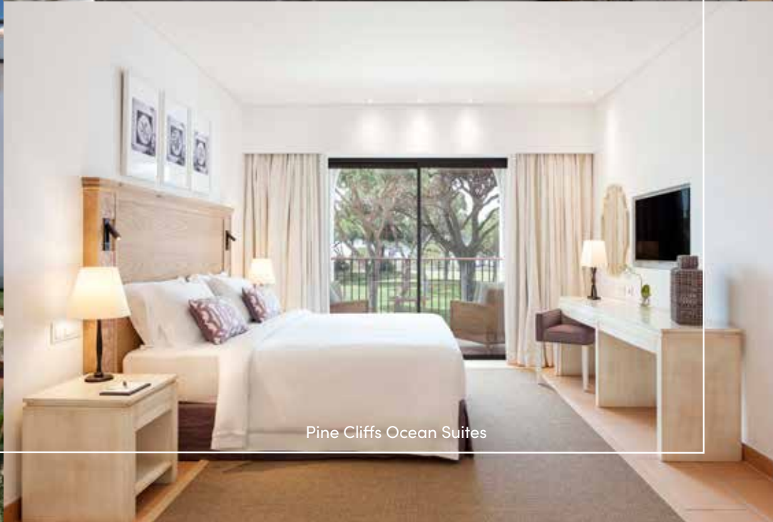
Pine Cliffs Ocean Suites