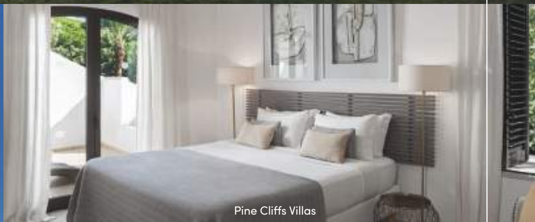
Pine Cliffs Villas