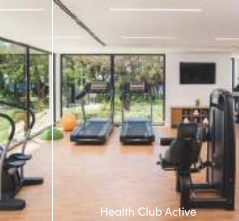
Health Club Active