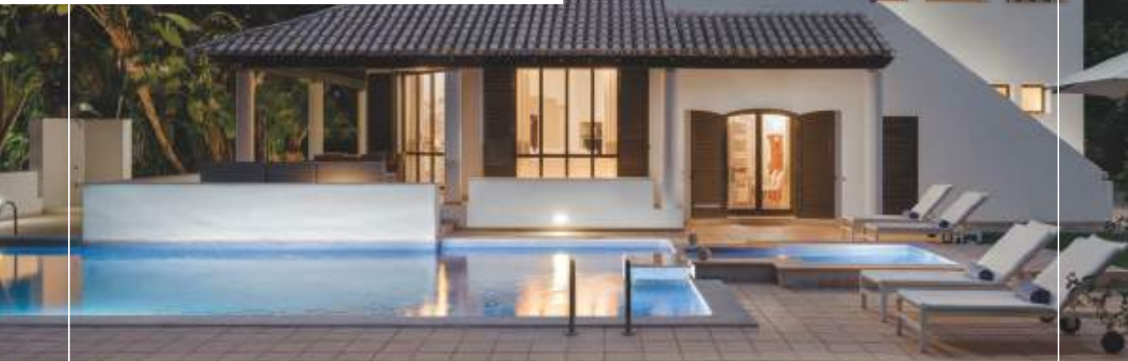
Pine Cliffs Villas

Whether you choose to stay in an apartment or a private villa, safety and tranquility are guaranteed.